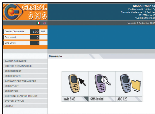
Figura 1 - Il pannello di configurazione e gestione dei servizi di Global SMS presenta un'interfaccia semplice e intuitiva

stanno affermando i cosiddetti SMS Gateway che, a un prezzo contenuto, consentono di integrare nel proprio sito un sistema di invio dei messaggi che può essere anche offerto ai navigatori: il sistema hardware/software che assolve al servizio è ospitato da società esterne le cui prestazioni vengono richiamate tramite un piccolo script HTML inserito in una normale pagina Web statica. In altre parole, per inserire in un sito un sistema per inviare SMS, non occorre altro che at-